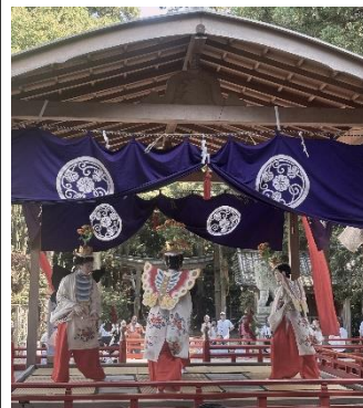
【みんなが知ってる「胡蝶の舞」】

校内では毎年3年生の児童が、「ふるさと学習」の中 でお師匠さんから稚児舞の講習を受けています。昨年度、 コロナ禍で子供たちが見学する機会がないまま4年が過 ぎ全校での見学を実施し、今年度より、参加する稚児の いる4年生、学習で稚児舞の講習を受ける3年生の見学 に変更して実施しました。3年生、4年生がそれぞれの立 場で、かつとんどのリズムとクラスメイトの素晴らしい舞の 数々を地域の方や観覧者と共に堪能しました。