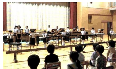
【学習発表会予行の様子】

9月12日(木)から体育館での学習発表会の練 習を開始した本年度ですが、予想を遙かに上回る 酷暑に対策を余儀なくされました。PTA 執行部に 相談をさせていただき、近隣の小学校より気化式冷 風機を4台借用しました。高さ150CMを超える大型 の冷風機のため運搬にも協力していただきました。 併せて体育館2階のギャラリーへ多目的1の冷房 の風を送り、体育館の気温が少しでも下がるよう 手を尽くしてきました。子供たちは厳しい制約の中 でも集中して時間を大切に練習を進めてきました。 当日は、演じる子供たち、鑑賞いただくご来賓、ご家 族皆が笑顔で過ごせることを願っております。本日 配布した「学習発表会の参観に当たってのお願い」 をご家族でご一読いただきますようお願いしま