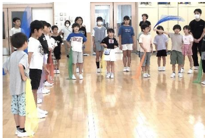
9月のコミュニケーションタイムは、 色をテーマにゲーム、全校合唱を!

研究推進指定を受けた昨年度より、全校児童が 「関わろう 楽しもう」を合言葉にコミュニケーション を図る「コミュニケーションタイム」を月1回行ってい ます。SLE (school life enjoy) 委員会の司会やデ モンストレーションのもと、英語の歌を通しての交 流、異年齢パートナーによる対話等を積み上げて きた下村っ子! 学習発表会当日は学習の成果の 発表を会場の皆様参加型の形式で行います。2年 間の成果を届ける子供たちと一緒に楽しんでいた だければと思います。