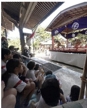
【素晴らしい舞に感動!!】

コロナ禍を経て、昨年度より完全実施となった地域の 下村加茂神社の秋祭「稚児舞」。まだまだ残暑厳しい気 候の中でしたが、夏休み中に練習を積んだ4名の稚児が 立派に地域の伝統を継承する姿に感動しました。