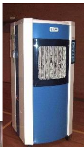
【会場4箇所に 大型冷風機設置】