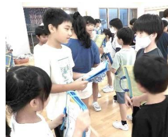
異年齢でのパートナーと行う 英語でのコミュニケーション

研究推進指定を受けた昨年度より、全校児童が 「関わろう 楽しもう」を合言葉にコミュニケーション を図る「コミュニケーションタイム」を月1回行ってい ます。SLE (school life enjoy) 委員会の司会やデ モンストレーションのもと、英語の歌を通しての交 流、異年齢パートナーによる対話等を積み上げて きた下村っ子! 学習発表会当日は学習の成果の 発表を会場の皆様参加型の形式で行います。2年 間の成果を届ける子供たちと一緒に楽しんでいた だければと思います。