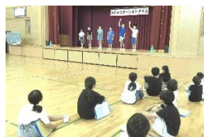
【コミュニケーションタイム：異年齢での関わりを楽しむ子供たち】