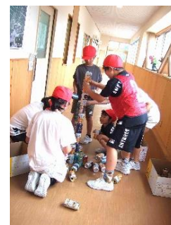
【9つのミッションと5つのクイズを知恵と力を合わせて取り組んだ下村っ子】