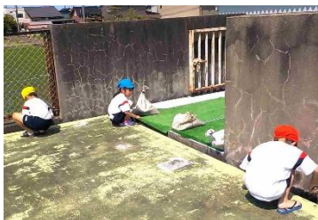
【プールの中も周りもピカピカに!】

今年度は全校児童数の減少から、1年生以外の児童46名がシャワースペース、小プール、周辺の溝、大プールの清掃に分担して取り組み、ピカピカにしました。輝くプールで今年度の泳ぎを楽しむ子供たちは、一人一人目当てをしっかりと立てて学習に取り組んでいます。短い期間ですが、一人一人が目標に向かって頑張る姿を応援したいと思います。