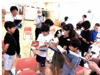
【5年生：自分の気持ちや考えを伝え合う言語活動！】