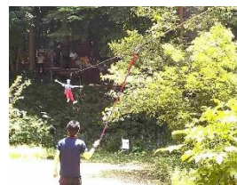
【森林浴で気分爽快! シップライン】