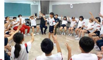
【5つの課題に挑んだ 「イニシアチブゲーム」】