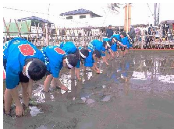
【緊張の中で立派にやり遂げた 「宮中新嘗祭献穀齋圃御田植祭」】

「宮中新嘗祭献穀齋圃御田植祭参加」(4～6年生 6月2日)「まこもの神様」づくり(3年生 6月7日)