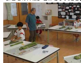
【野上宮司さんの指導で真剣に 「まこもの神様」を作る子供たち】

また、下村加茂神社で8日に行われた「御田植祭」に向けて、3年生が校内で宮司さんの指導を受けながら、「まこもの神様」作りを体験しました。