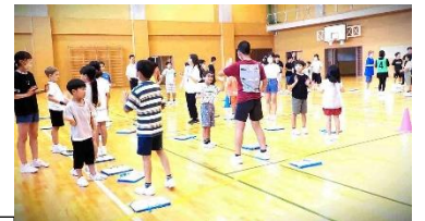
【たくさんの人たちと伝え合ったひととき】

2年間の外国語活動・外国語科の研究推進指定を受け、3～6年生の授業研究を進めるとともに、全校体制で集会「コミュニケーションタイム」を継続実践し、コミュニケーション力の育成を目指しています。14日(木)は、進んで関わる子供たちの姿を目指し、2人組のパートナーによるコミュニケーション活動を行いました。互いに自分の名前を伝え、今の気分を聞き合い、サインをし合って分かれます。簡単なようですが子供たちの話す言語は英語です。一生懸命頑張っている子供たちもいっぱいです。活動が進む中で、子供たちの笑顔がいっぱいになっていく、とても素敵なおひとときです。今後も、関わりを広げ、人とのコミュニケーションを楽しむ子供たちであるよう活動を推進していきます。