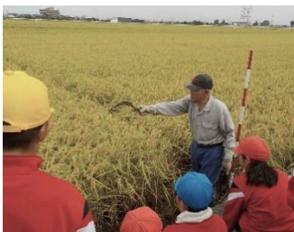
【小澤先生に たくさん教えていただきました】