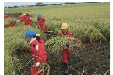
【一生懸命に取り組みました】

例年実施させていただいていた田植えは、本年度は休耕田の関係で行えませんでした。田んぼの先生のご好意で、急遽場所を変えて4年生・5年生が、田んぼの先生の指導の下、稲刈り体験させていただきました。昨年度体験している5年生は、手際よく刈り取り、友達と協力して運ぶなど、先輩として貫禄ある作業ぶりでした。