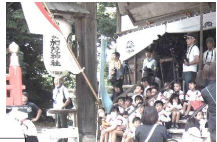
【素晴らしい舞に感動!!】

コロナ禍を経て、4年ぶりの完全実施となった地域の下村加茂神社の秋祭「稚児舞」。地球沸騰化の酷暑の夏が終わっても残暑厳しい気候の中でしたが、夏休み中に練習を積んだ4名の稚児が立派に地域の伝統を継承する姿に感動しました。校内では毎年3年生の児童が、「ふるさと学習」の中でお師匠さんから稚児舞の講習を受けていますが、コロナ禍で子供たちが見学する機会がないまま4年が過ぎました。冒頭でも述べましたが、今年度、短い時間でしたが、下村っ子みんなが稚児舞の実際を見る機会をとおらせていただきました。踊りを経験している3年生以上の児童、これから踊りを経験する1・2年生、それぞれの立場で、かつとんのリズムと素晴らしい舞の数々を地域の方や観覧者と共に堪能しました。