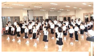
【ランチルームでの始業式】