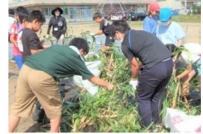
【収穫といのちへの感謝「片づけ作業」まで】