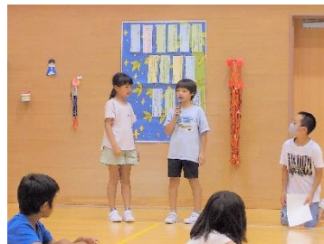
【各学年代表者による願い事の発表】

昨年度は中止となった、伝統の6年生企画「七夕集会」が、全校体育館に集結して実施されました。各学年からの願い事の紹介や6年生10名全員による、七夕劇の上演が行われ楽しいひと時を過ごしました。願い事が叶うよう、自分自身の努力も忘れずに頑張っておりました。