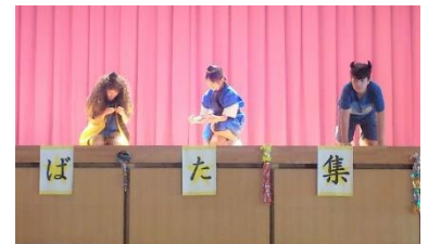
【全校を楽しませた6年生の七夕劇】