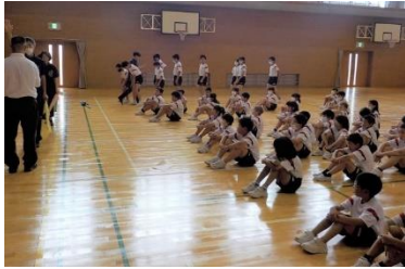
【教職員・児童共、真剣に取り組む避難訓練の様子】