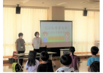
【実演や映像から納得がいっぱいの防犯教室】

7月10日に不審者対応を想定した「避難訓練」を、7月18日には夏季休業中の安全指導も含めた「防犯教室」を実施しました。避難訓練では不審者の行動次第で安全な避難には臨機応変な教師の判断が求められることを改めて学びました。子供たちの命を守る学校であることを最優先に、今後も不測の事態に備えた訓練を行っています。防犯教室では、自分の身を守るための備えや行動について詳しく教えていただきました。