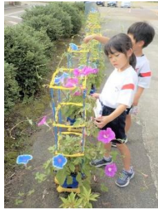
【目で日々変化する植物の命の神秘に感動！】

教育支援ボランティアの方に耕していただいた学校の畑では、全学年が栽培活動を展開しました。5年生のトウモロコシ、6年生のじゃがいもは無事収穫を終えました。また、ボランティアの方のアドバイスで3年生は玄関前でヒマワリを育て、4年生は宮司さんから水菜の繁殖を教えていただきチャレンジしています。毎日植物がすくすく育つ様子に感動がいっぱいの子供たちでした。一人一鉢の低学年のアサガオと野菜栽培も大成功でした。