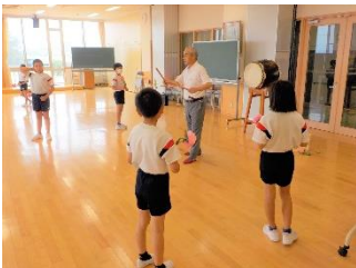
【めきめき上達し、踊りを楽しむ3年生】