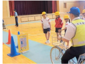
【実際の道路を想定した練習】