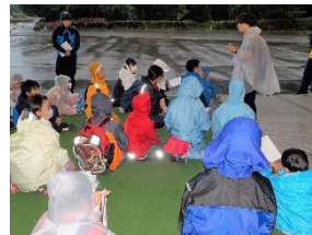
【雨にも負けずに「ナイトアドベンチャー」山の中で迷いながらのポイント探し】