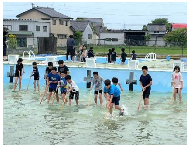
【プールの中も周りもピカピカに！】

3～6年生が、小プール、周辺の溝、大プールを分担してピカピカにしました。輝くプールで今年度の泳ぎを楽しむ子供たちは、一人一人目当てをしっかりと立てて学習に取り組んでいます。今年度の夏季休業中のプール開放については、7月に詳細をお知らせいたします。