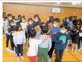
<コミュニケーションタイム>英語でじゃんけんを楽しむ子供たち